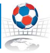
SPORTOVNI HALA VUT V BRNE