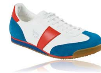
CLASSIC 08 - model - CLASSIC 08 38-46 EUR - size - 38-46 EUR ID49413-7-823 - code - ID49414-7-824