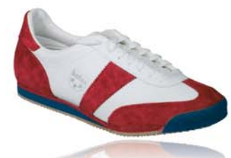
CLASSIC - model - CLASSIC XXL 35-49, 51 EUR - size - 53, 54, 55 EUR ID46481-7-539 - code - ID46481-7-540