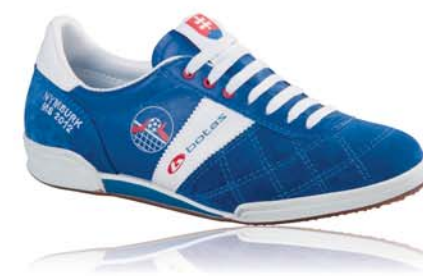
MS NYMBURK 2012 SK team - model 41-47 EUR - size ID42415-7-144 - code