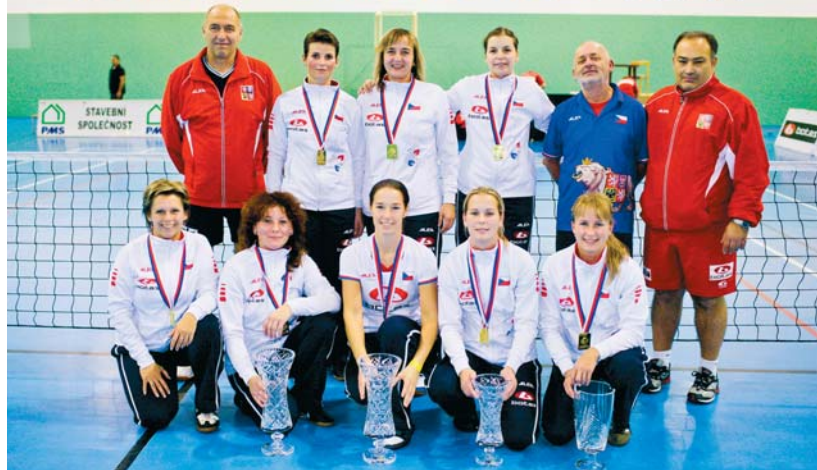
SPORTOVNI HALA VUT V BRNE