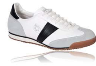
CLASSIC 08 - model - CLASSIC PREMIUM 38-46 EUR - size - 35-49, 51 EUR ID43437-7-207 - code - ID46482-7-538