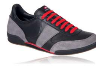
CLASSIC PRO - model 41-47 EUR - size OD43531-7-208 - code

detailní popis každého výrobku najdete na