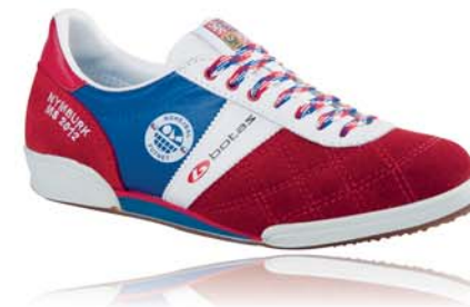
MS NYMBURK 2012 CZ team - model 41-47 EUR - size ID42414-7-143 - code