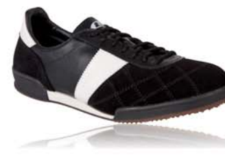
MASTER PRO - model - MASTER 41-47 EUR - size - 41-47 EUR ID42411-7-101 - code - ID42412-7-102